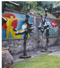
Scorcio dello studio di Fiesole

Se all'esterno è aperto un dialogo continuo fra natura e scultura, figure slanciate di grandi dimensioni che esaltano il movimento,