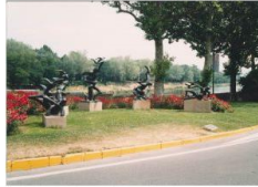
Fontana della Maternità

Conoscevo Sauro Cavallini e le sue sculture. Dal gruppo della "Fontana della Maternità" del giardino di piazza Ferrucci