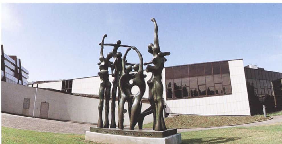
Sauro Cavallini, Monumento alla Vita, Palazzo del Consiglio d'Europa a Strasburgo

La Florence Biennale, in occasione della XI edizione che avrà luogo dal 6 al 15 ottobre 2017 negli storici spazi della Fortezza da Basso di Firenze, onora la memoria dello scultore Sauro Cavallini, scomparso il 28 luglio 2016, conferendo il "Premio Lorenzo il Magnifico alla carriera" con la seguente motivazione: "Il Premio speciale 'Lorenzo il Magnifico' alla memoria è tributato a Sauro Cavallini per aver magistralmente infuso, attraverso l'arte della scultura, vita alla forma, conferendo levità e movimento al bronzo di figure originali quanto armoniose che sono espressione di uno straordinario estro creativo".