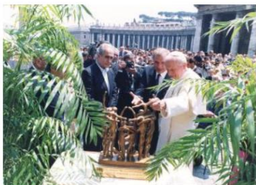
Sauro Cavallini dona a Papa Giovanni Paolo II il bozzetto del "Monumento alla Vita"

L'opera più nota di Sauro Cavallini è il Monumento alla Vita , il cui bronzo di oltre 3 metri di altezza si può ammirare a Strasburgo (F) davanti al Palazzo del Consiglio d'Europa , mentre il modello in scala fu donato a Papa Wojtyła durante una cerimonia ufficiale nel 1992.