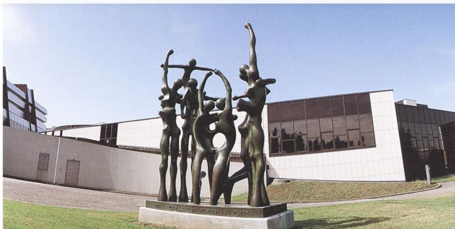
Sauro Cavallini, Monumento alla Vita, Palazzo del Consiglio d'Europa a Strasburgo

La Florence Biennale , mostra internazionale di arte, in occasione della XI edizione che avrà luogo dal 6 al 15 ottobre 2017 negli storici spazi della Fortezza da Basso di Firenze, onorerà domenica 8 ottobre alle ore 11:00 la memoria dello scultore Sauro Cavallini , scomparso il 27 luglio 2016, conferendogli il “Premio Lorenzo il Magnifico alla carriera” con la seguente motivazione: “Il Premio speciale ‘Lorenzo il Magnifico’ alla memoria è tributato a Sauro Cavallini per aver magistralmente infuso, attraverso l’arte della scultura, vita alla forma, conferendo levità e movimento al bronzo di figure originali quanto armoniose che sono espressione di uno straordinario estro creativo” . A celebrazione del grande scultore recentemente scomparso saranno esposti durante la Biennale per la prima volta insieme, il disegno dell’Ultima Cena (1979), i tre bozzetti in bronzo dell’Ultima Cena (ca. 1982-1987), nonché il busto di un discepolo facente parte dell’opera monumentale in gesso che raffigura lo stesso soggetto (1988), la cui fusione in bronzo è incompiuta e che misurerà 16x7mt.